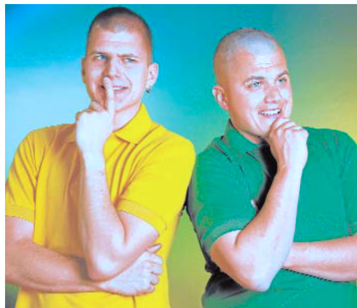
Die Gebrüder Kälin aus Galgenen: Schaffen die beiden den Einzug ins Finale des «Kleinen Prix Walo»?