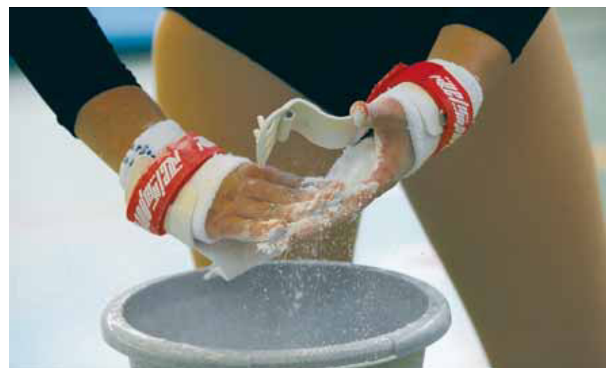
Für diese Turnerin gilt es gleich ernst: Ein letztes Magnesiumbad garantiert Halt an den Ringen.