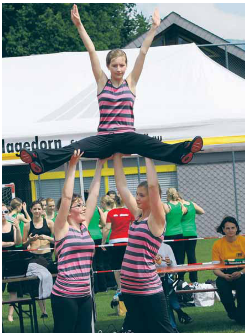
Die jungen Einsiedlerinnen überzeugten beim Team-Aerobic.

RANGLISTENAUSZÜGE SIEHE SEITE 15. DIE DETAILLIERTEN RANGLISTEN SIND IM INTERNET UNTER WWW.STV-TUGGEN.CH ABZURUFEN.