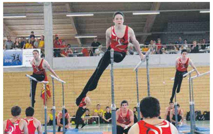
Der STV Wangen zeigte eine bis ins letzte Detail geplante Choreographie.