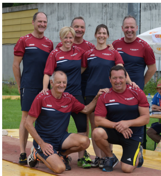
Das starke Steinstossteam

Das Endtotal ergab somit 26.79, dies reichte schlussendlich zum tollen 31. Rang in der Kategorie Senioren.